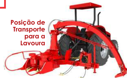
Posição de Transporte para a Lavoura