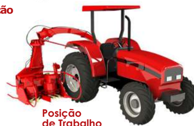
Posição de Trabalho

Alta tecnologia em caixas de transmissão com forte sistema de cardan